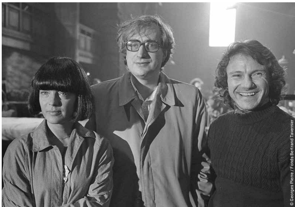
Romy Schneider, Bertrand Tavernier et Harvey Keitel sur le tournage de La Mort en direct de Bertrand Tavernier (1980)