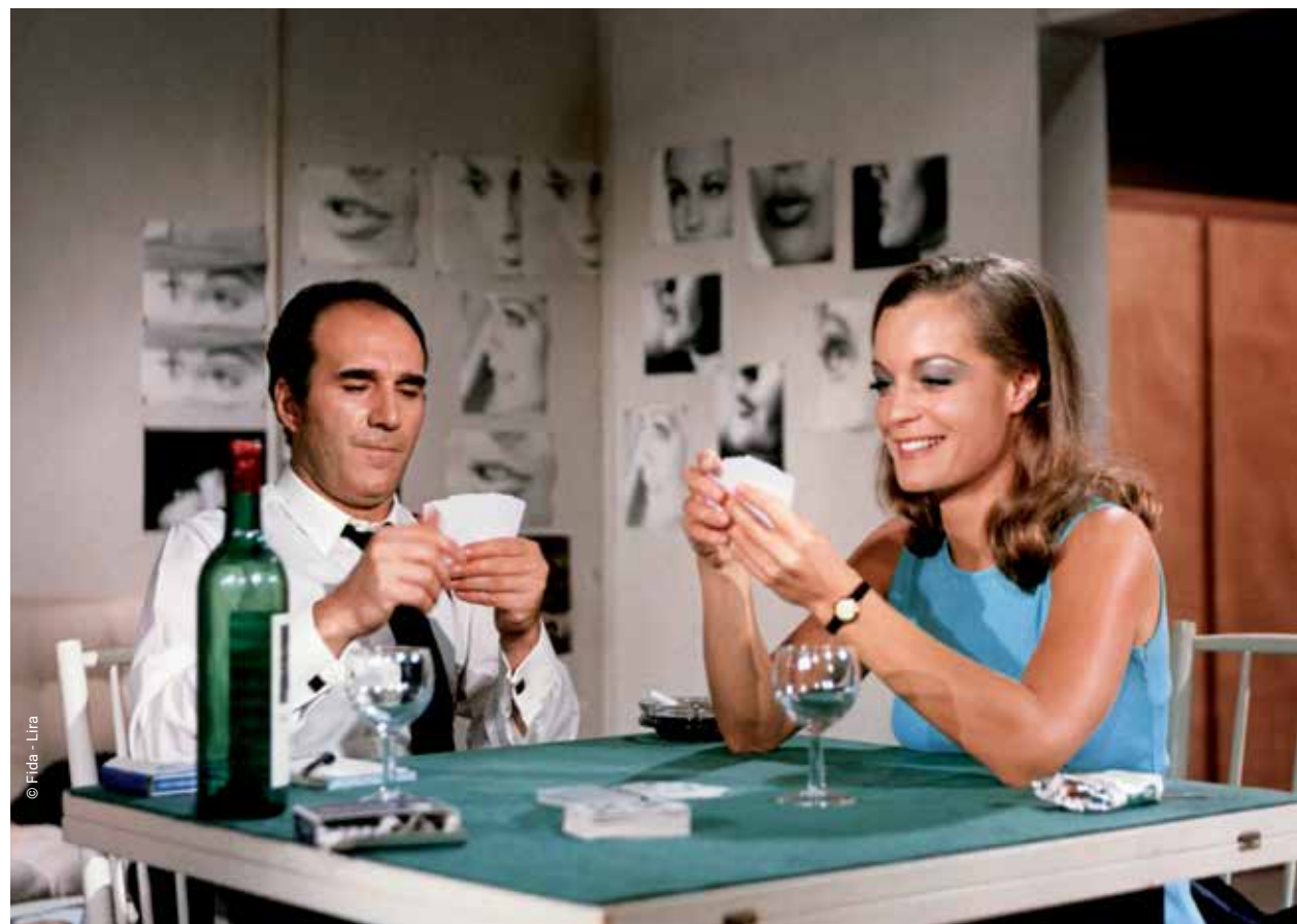
Michel Piccoli et Romy Schneider dans Max et les ferrailleurs de Claude Sautet (1971)

de Claude Sautet (France, Italie, 1971, 1h51, coul.) Max (Michel Piccoli), policier obsédé par le flagrant délit, croise par hasard un ami de jeunesse devenu voyou... Un film policier servi par un scénario d'une grande finesse. Avec Romy Schneider, envoûtante dans l'un de ses rôles les plus remarquables. Ma 10/03 à 18h30 – Di 15/03 à 14h30 – Je 26/03 à 21h