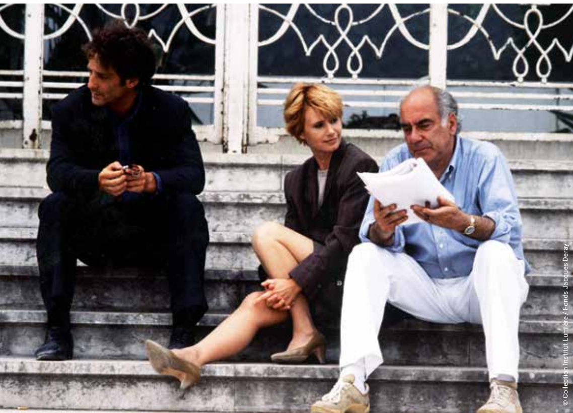
Vincent Lindon, Miou-Miou et Jacques Deray sur le tournage de Netchaïev est de retour (1991)