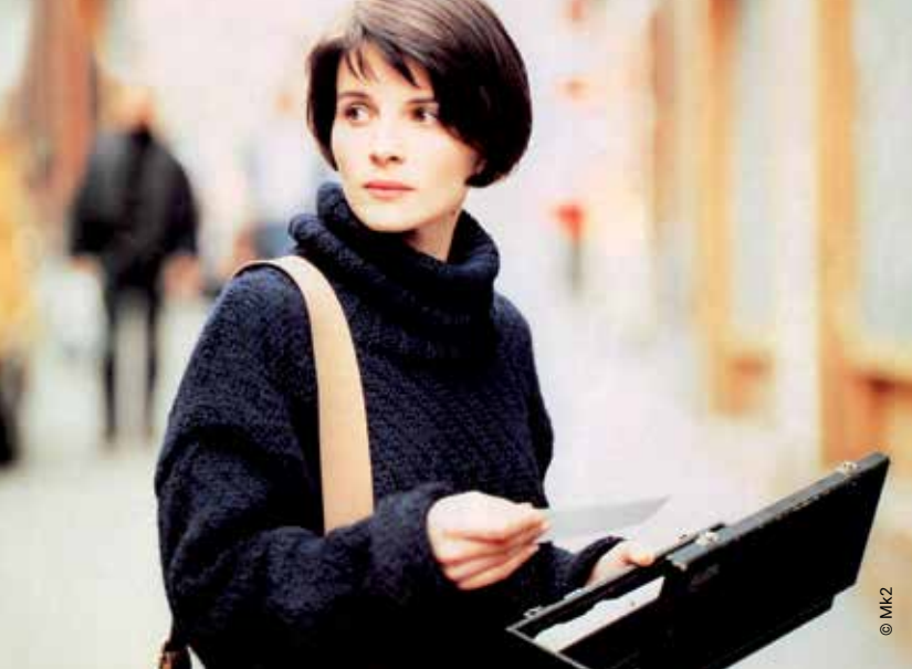
Juliette Binoche dans Trois couleurs : Bleu de Krzysztof Kieslowski (1993)

Krzysztof Kieslowski : « Si je devais donner le message essentiel du Décalogue, ce serait : "vivez avec égards, regardez autour de vous, prenez garde à ce que vos actions ne causent pas de préjudice aux autres, ne les blessez pas ou ne leur causez pas de peine". »