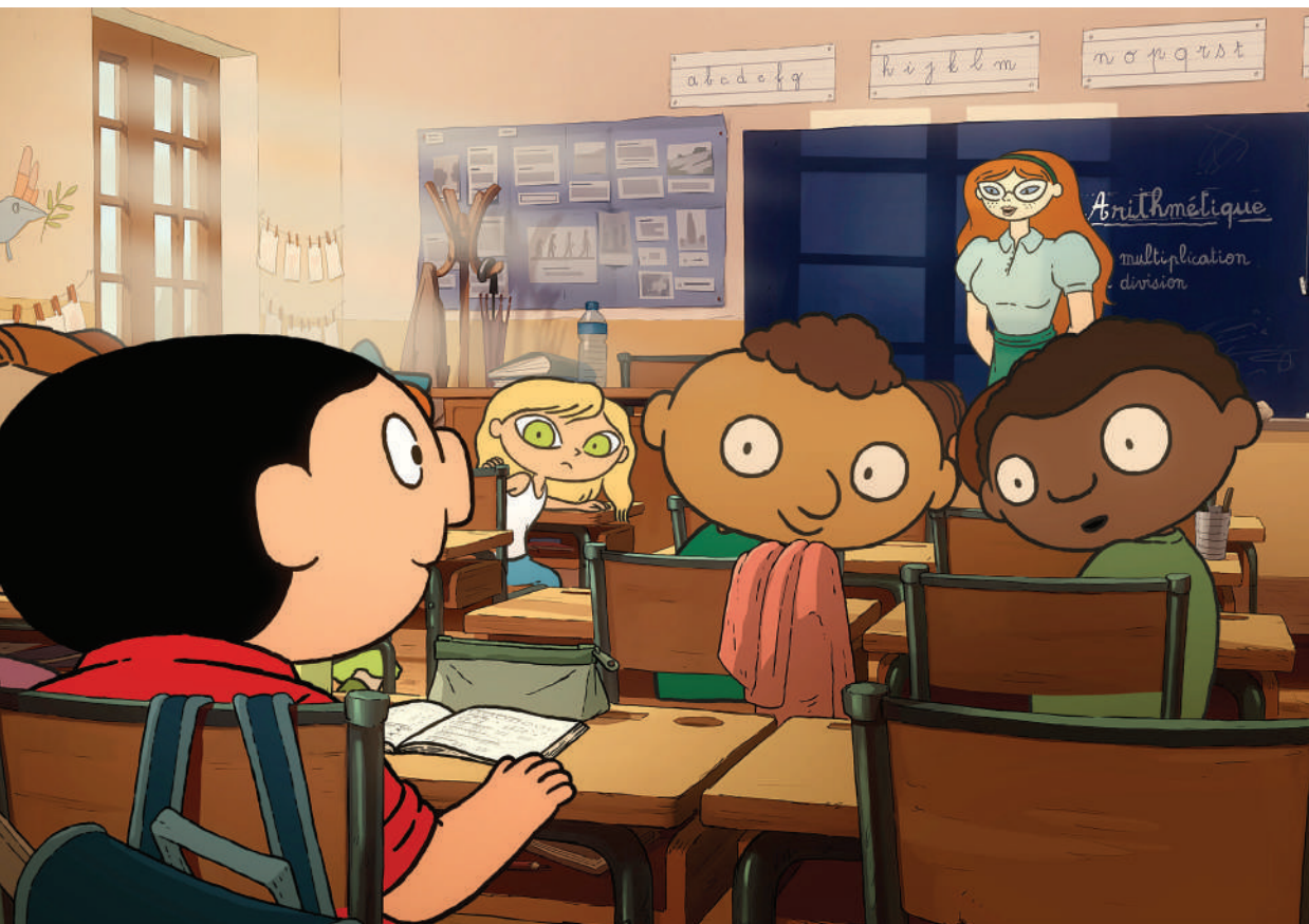
Petit Vampire de Yoann Sfar

En cadeau à la fin de chaque projection, un thaumatrope sur le film projeté !