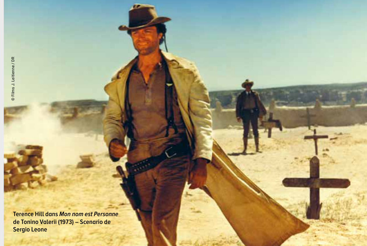
Terence Hill dans Mon nom est Personne de Tonino Valerii (1973) – Scénario de Sergio Leone