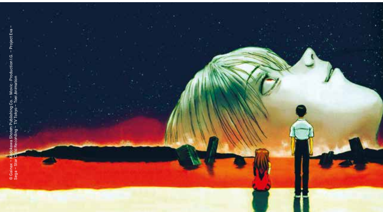
The End of Evangelion de Hideaki Anno (1997)