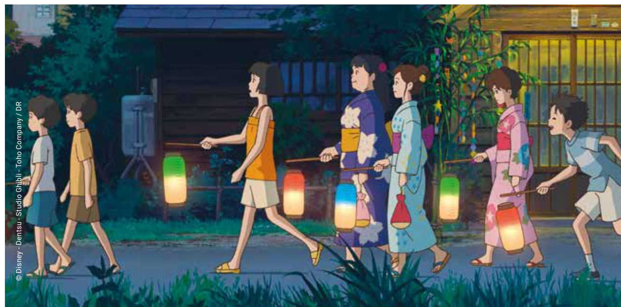
Souvenirs de Marnie de Hiromasa Yonebayashi (2014)