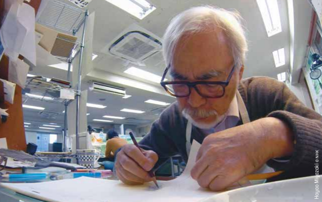
Hayao Miyazaki