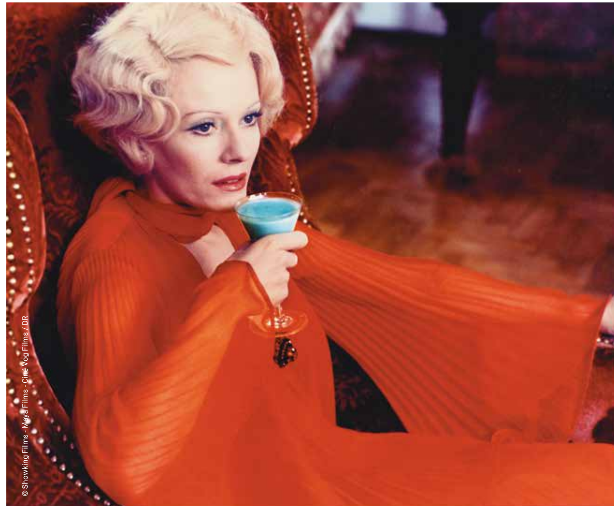
Delphine Seyrig dans Les Lèvres rouges d'Harry Kümel (1971)