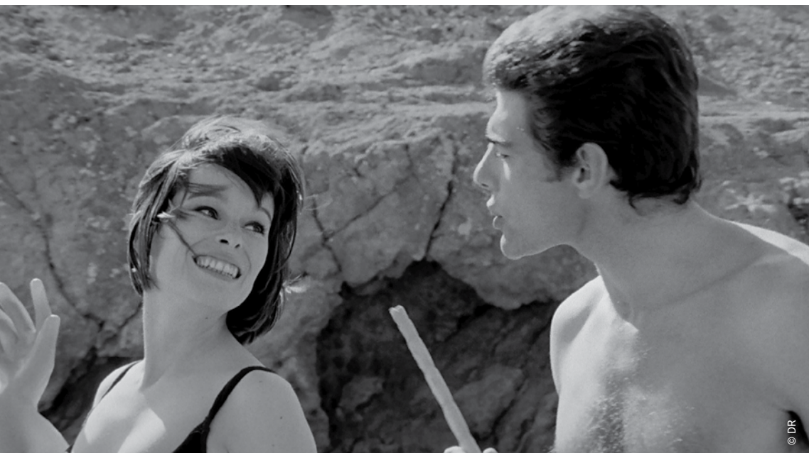
Geraldine Chaplin et Juan Luis Galiardo dans Stress es tres tres (1968)