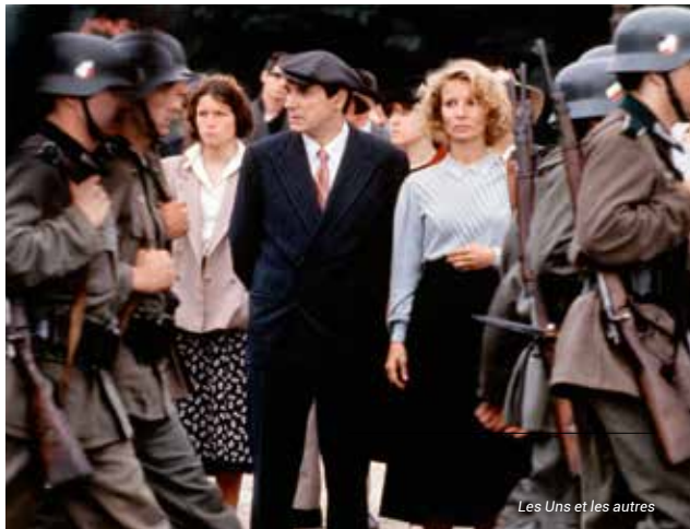
Les Uns et les autres

Plus d'informations sur les films de la programmation et sur les événements, sur www.institut-lumiere.org