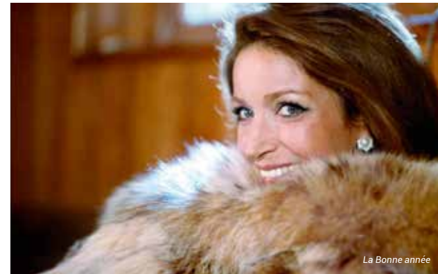
La Bonne année

1935-1945. Les trajectoires d'un flic et d'un gangster, chef du gang des Traction-Avant... Une chronique passionnante de l'Occupation et vraie réflexion sur l'héroïsme et l'opportunisme. Avec Marlène Jobert, Jacques Dutronc.