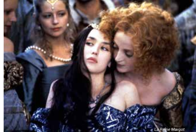
La Reine Margot

À la veille de la Guerre de Sécession, les aventures de Scarlett O'Hara, aristocrate du Sud, bientôt sous le charme d'un capitaine... Œuvre légendaire, avec Vivien Leigh et Clark Gable.