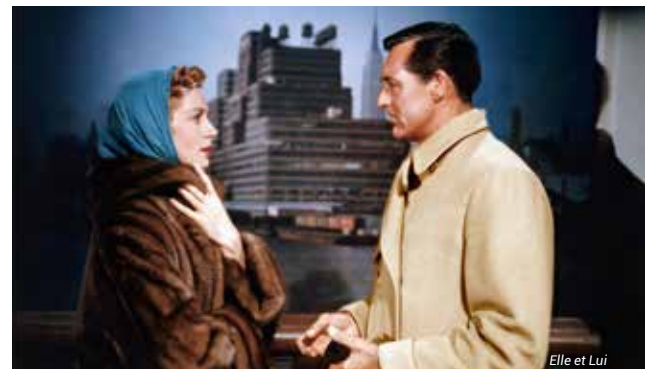
Elle et Lui