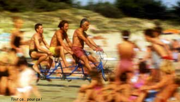
Tout ça... pour ça !