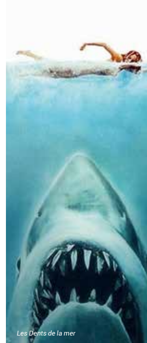
Les Dents de la mer