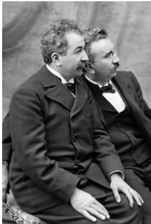
— Louis et Auguste Lumière