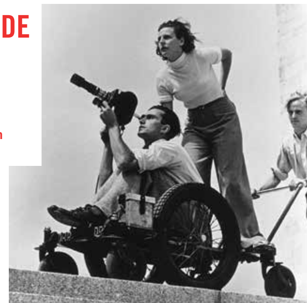
— Leni Riefenstahl sur le tournage Les Dieux du stade

À l'Institut Lumière et dans toute la Région Auvergne/Rhône-Alpes.