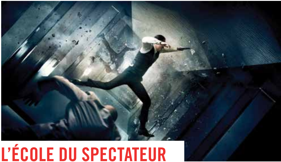
— Inception de Christopher Nolan