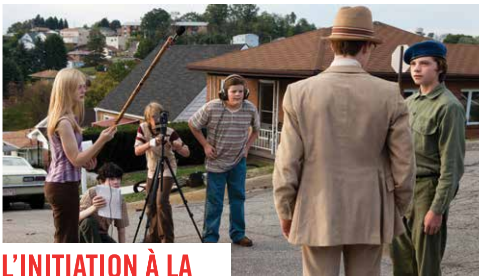
— Super 8 de J. J. Abrams