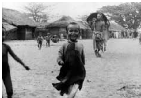
— Photogramme Lumière