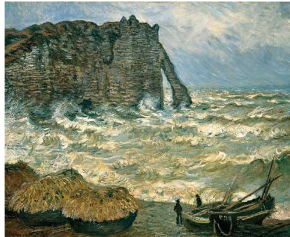
— Etretat, mer agitée de Claude Monet 1883 Musée des Beaux-Arts (détail)

🕒 DURÉE DES VISITES : 1h30 environ Uniquement le mercredi, le jeudi et le vendredi