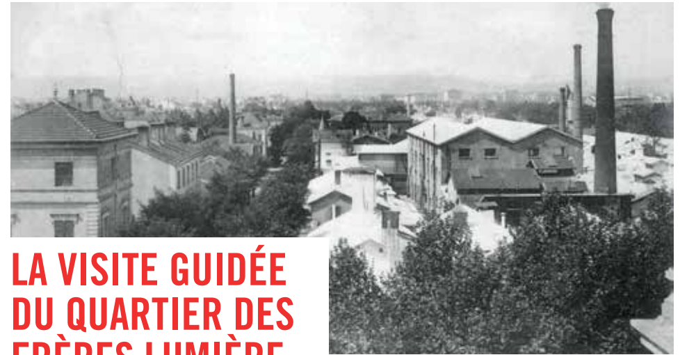
— Les Usines Lumière de Monplaisir

🕒 DURÉE : 1h — à partir du collège Sous-titré en anglais (sur demande)