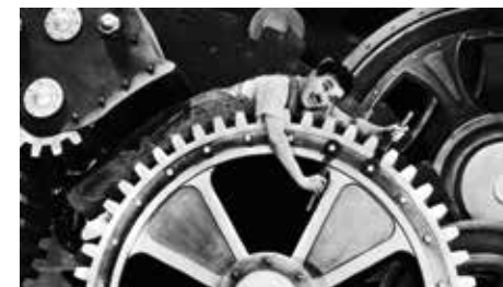
— Les Temps modernes de Charlie Chaplin

Niko, le petit renne, vit avec sa maman et toute la tribu dans la paisible Vallée des rennes. En secret, Niko ne rêve que d'une chose : rencontrer son père, membre de la légendaire Brigade du Père Noël. Pour cela, le petit renne s'entraîne sans cesse à voler afin de rejoindre le village du Père Noël... Pétillant de poésie, ce périple haletant est pétri de valeurs universelles et marquera tout en douceur le début de l'hiver et la fin de l'année 2018.