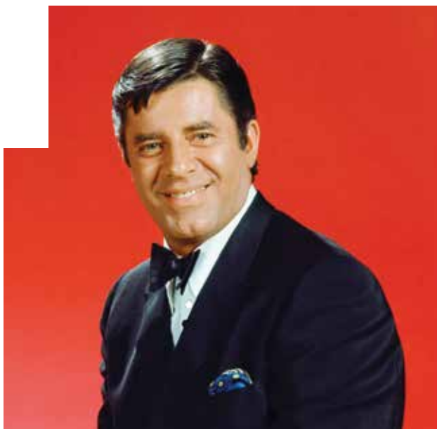
— Jerry Lewis