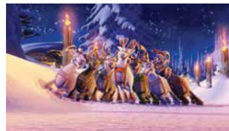
— Niko le petit Renne de Kari Juusonen

Ouverture des portes 30 minutes avant la séance