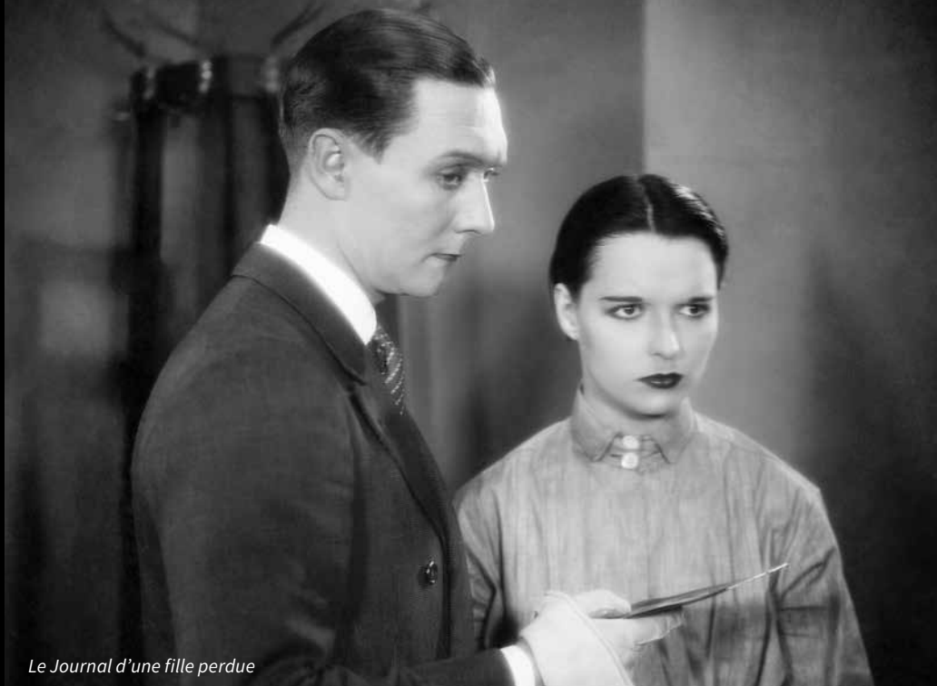
Le Journal d'une fille perdue