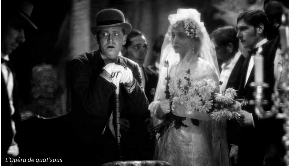
L'Opéra de quat'sous