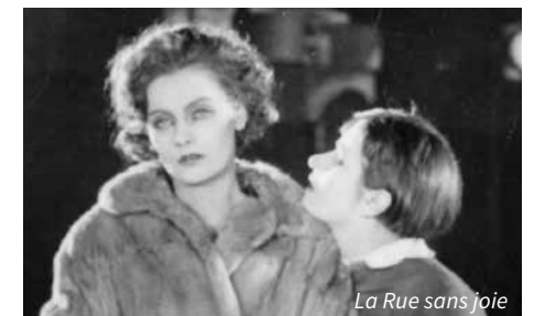
La Rue sans joie

Le docteur Krafft perd sa femme lors d'une chute en montagne. Dix ans plus tard, un jeune couple se rend en expédition au même endroit et rencontre Krafft, persuadé que son épouse est toujours en vie... Classique du film de montagne, film d'aventure aux images époustouflantes, coréalisé par Arnold Fank et avec Leni Riefenstahl.