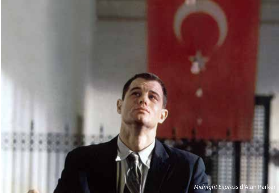
Midnight Express d'Alan Parker