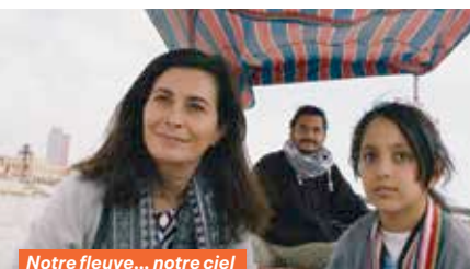
Notre fleuve... notre ciel