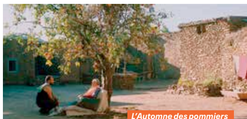
L'Automne des pommiers