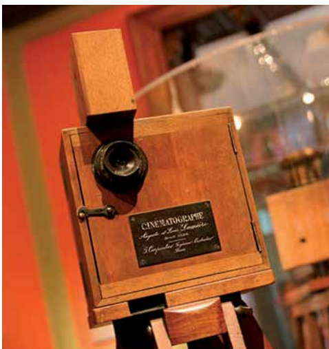
Le Cinématographe n°1

Avec projection de photographies, de films Lumière et de nombreux extraits de documentaires sur le pré-cinéma.