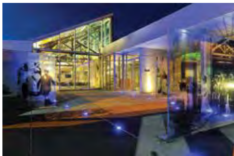
Le Hangar du Premier-Film

INSTITUT LUMIÈRE - Président : Bertrand Tavernier 25 rue du Premier-Film - 69008 Lyon