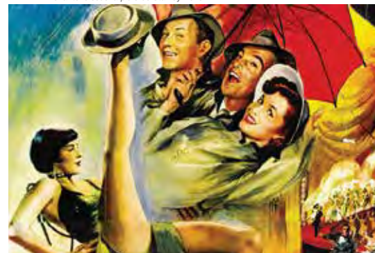
Chantons sous la pluie de Stanley Donen

Elle couvre presque tous les champs du rapport entre le spectateur et le film et est ainsi devenue le modèle de très nombreux cinéastes. Ce documentaire propose 6 grands extraits analysant les techniques de fonctionnement du récit ( La Mort aux trousses ), de création d'effets dramatiques ( Soupçon ), de plan séquence ( La Corde ), de montage ( Psychose ), de regard subjectif ( Fenêtre sur cour ) et de hors champ ( Les Oiseaux ).