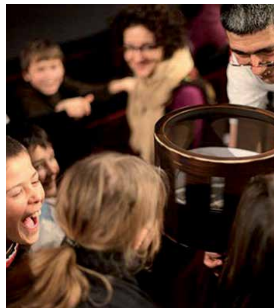
Démonstration du Zoetrope