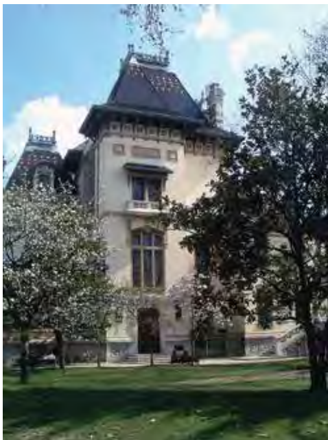
La Villa Lumière

Pique-nique possible dans le Parc Lumière. En cas de pluie, accès au kiosque à musique place Ambroise Courtois. Nombreux restaurants à proximité.