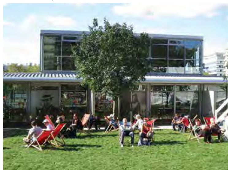
Le Parc Lumière pendant le festival

Pour la mémoire du cinéma, l'Institut Lumière et l'éditeur Actes Sud publient des livres de cinéma (une trentaine de titres jusqu'à présent) et a également lancé sa propre collection DVD.