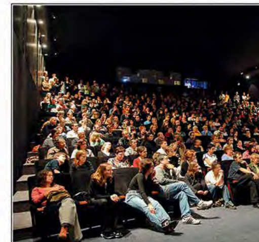
Kevin Costner sur le tournage de Danse avec les loups (1990)