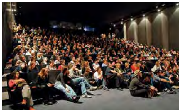
Salle de cinéma - Hangar du Premier-Film

Profitez d'une visite au Musée Lumière pour assister à une séance dans un lieu emblématique !