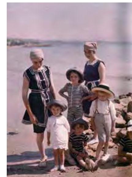
Autochrome Lumière, La Ciotat 1913

Du samedi 1er au dimanche 30 Tous les jours sauf le lundi 15h Visite découverte Ouvert le 15 août