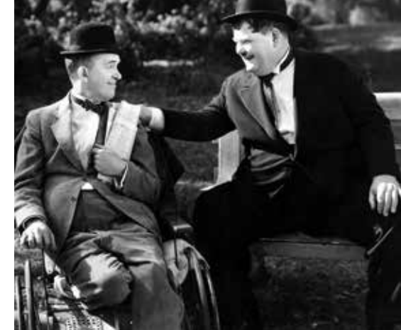
Laurel et Hardy - Têtes de pioche