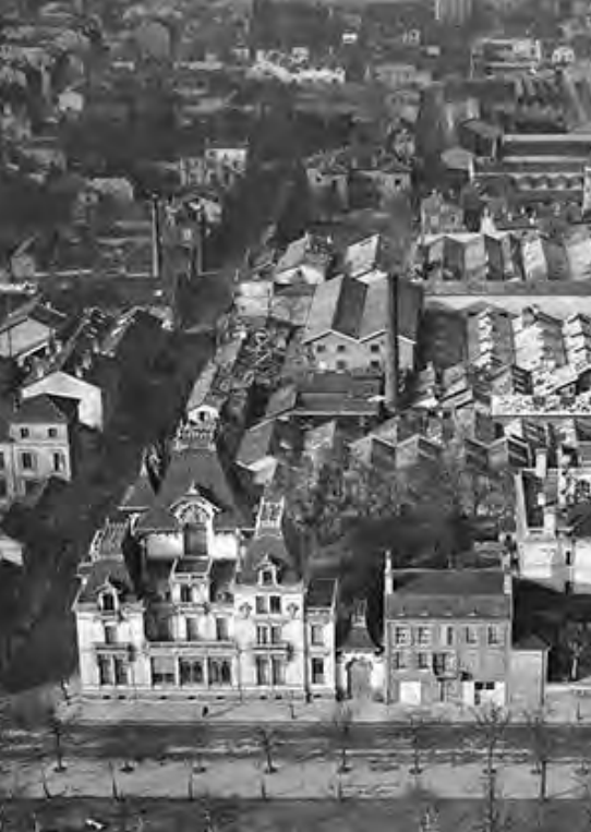
Vue aérienne du quartier Monplaisir - 1920