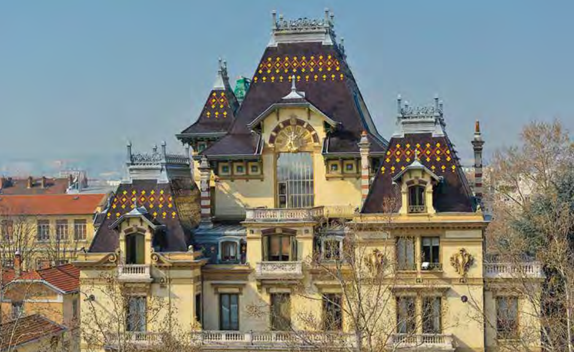
Villa Lumière - Côté Place Ambroise Courtois - J.L. Mège