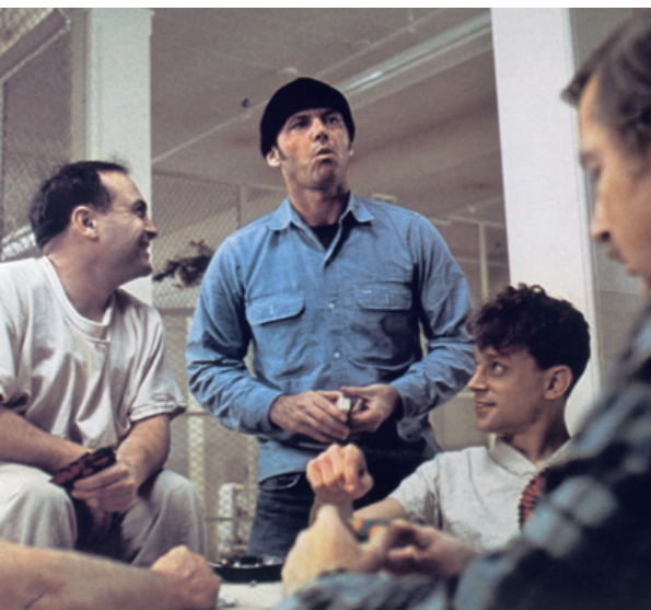
Vol au-dessus d'un nid de coucou

Avocat fauché, Paul Biegler est sollicité par Laura Manion pour défendre son mari, emprisonné pour avoir tué l'homme qui venait de la violer... Immense classique du film de procès, virtuose et percutant. ( Anatomy of a Murder , USA, 1959, 2h40, N&B, avec Eve Arden, James Stewart, Lee Remick, Ben Gazzara)