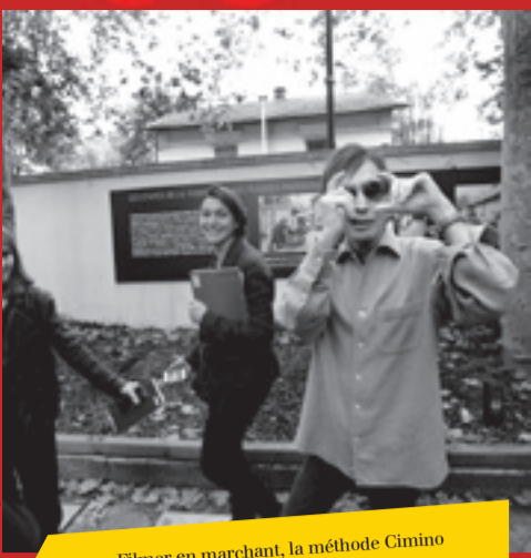
Filmer en marchant, la méthode Cimino

Tous les jours. Un peu partout sur les écrans de cinéma lyonnais: «Nos vies ne seraient rien sans le cinéma...» Pedro Almodóvar.