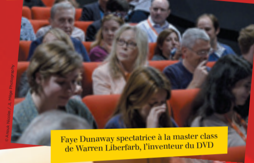
Faye Dunaway spectatrice à la master class de Warren Liberfarb, l'inventeur du DVD