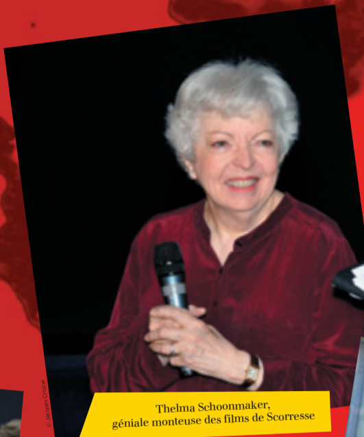
Thelma Schoonmaker, géniale monteuse des films de Scorsese