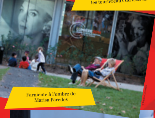
Farniente à l'ombre de Marisa Paredes