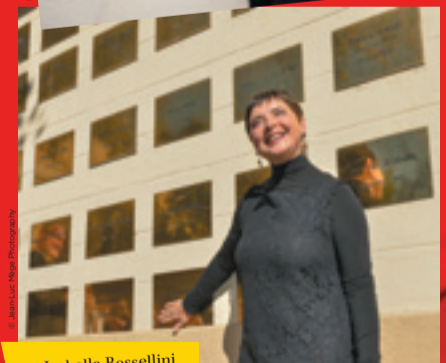
et Isabella Rossellini