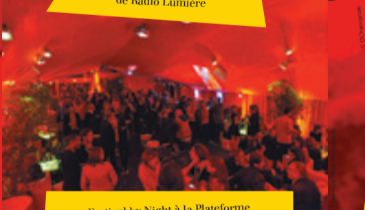
Festival by Night à la Plateforme