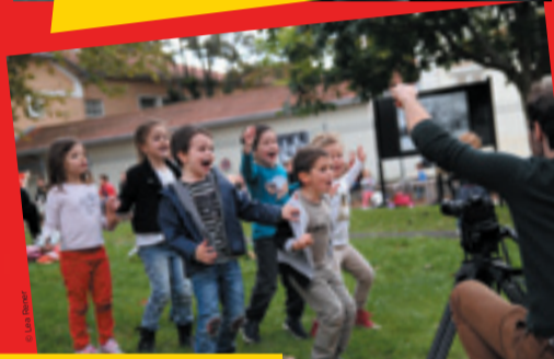
Petits acteurs en liberté