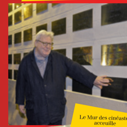
Le Mur des cinéastes accueille le britannique, Alan Parker