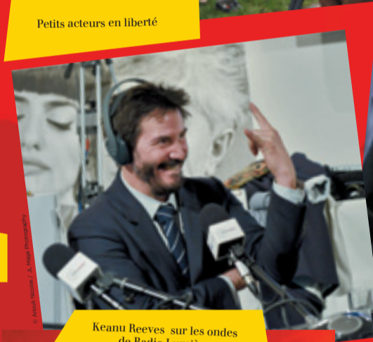
Keanu Reeves sur les ondes de Radio Lumière