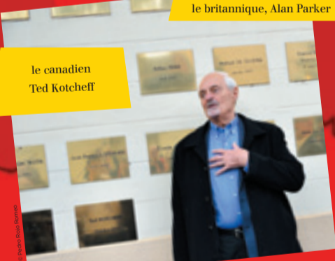
le canadien Ted Kotcheff