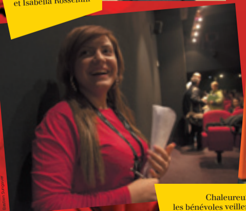
Chaleureux et souriants, les bénévoles veillent au bon déroulement du festival