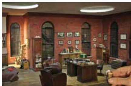
▲ Miniature d'une chambre à Manhattan

Le Musée Cinéma et Miniature est situé en plein cœur du Vieux Lyon. Il vous entraîne à la découverte de deux expressions rares et insolites : l'art des effets spéciaux dans le cinéma et la magie de la miniature.