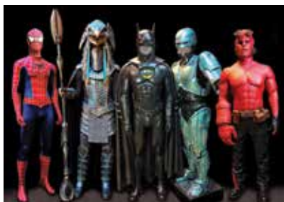
▲ Cinq costumes originaux de films légendaires