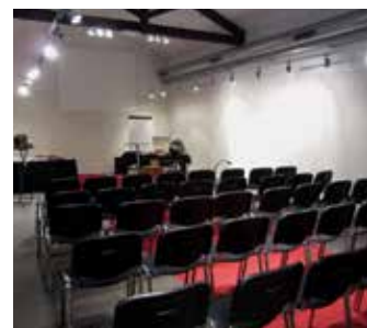
▲ La salle pédagogique de l'Institut Lumière

Le travail d'apprentissage du langage cinématographique s'apprend en regardant des images mais aussi en apprenant leur mode de fabrication. Cela peut se faire par la pratique d'exercices simples qui permettent aux élèves une prise de conscience plus concrète de la grammaire du langage filmé.