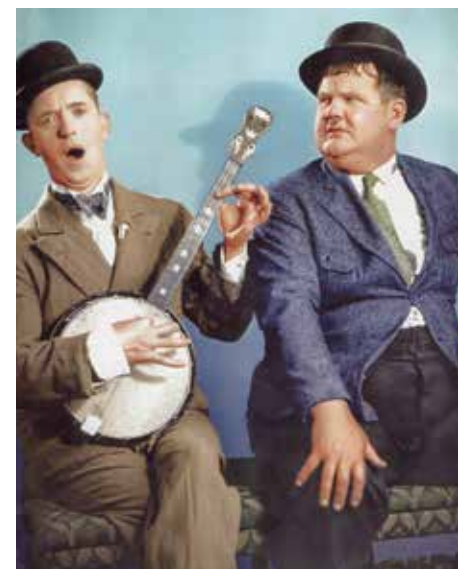
▲ Laurel & Hardy

La comédie américaine au temps du muet ! Une projection commentée en direct adaptée aux tout petits !