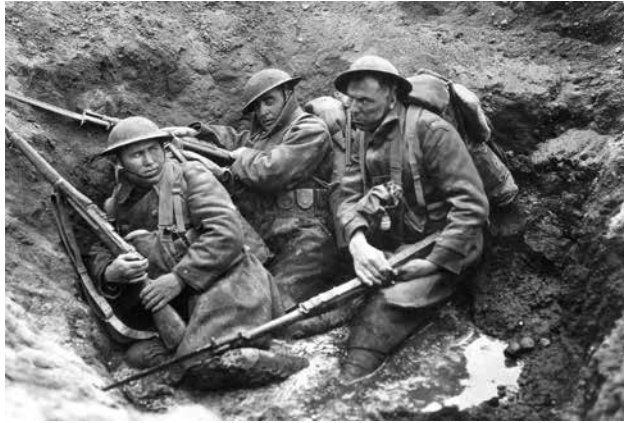
▲ La Grande Parade de King Vidor

Le cycle de conférences « Histoire et Cinéma » aborde différentes périodes du programme d'Histoire contemporaine du collège et du lycée en montrant combien les films sont des témoins de leur temps. Chaque conférence s'appuie sur de nombreux extraits de films. Ces conférences permettent la transdisciplinarité des enseignements (lettres, philosophie, langues) en fonction des séances. Enfin, des fiches pédagogiques à compléter accompagnent le plan de la conférence et reprennent les titres des films utilisés.