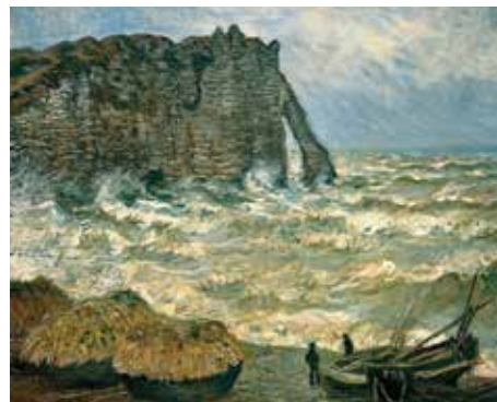
▲ Mer agitée de Claude Monet (détail)

Combinez votre visite du Musée Lumière avec le Musée des Beaux-Arts.