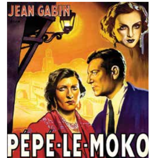
▼ Pépé le Moko de Julien Duvivier

Le cinéma français est un cinéma social qui a fait des citoyens ordinaires des héros de cinéma. Des ouvriers des années des trente glorieuses aux banlieusards des années de crise en passant par des femmes luttant pour leur émancipation ou par les années sida. Bien des films ont illustré l'évolution de la société française par la comédie comme par le drame.