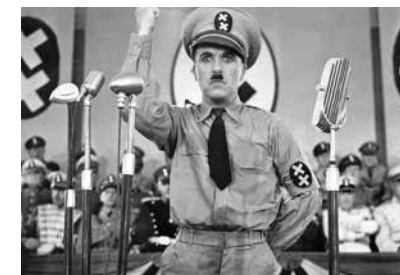
▲ Le Dictateur de Charlie Chaplin

Le cinéma français des années 1930 aux années 1970 pour redécouvrir les moments incontournables de son histoire, à travers une sélection d'extraits de films emblématiques.