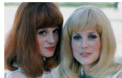
▲ Catherine Deneuve et Françoise Dorléac

Les techniques du récit ( La Mort aux trousses ), les effets ( Soupçons ), le plan séquence ( La Corde ), l'art du montage ( Psychose ), la subjectivité et la manipulation ( Fenêtre sur cour ) et le hors champ ( Les Oiseaux ).