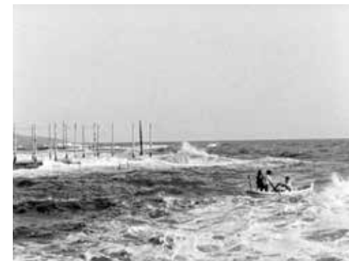
▲ Sortie en mer de Louis Lumière