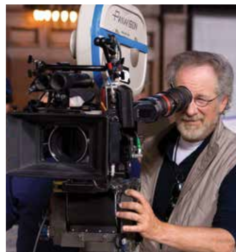
▲ Steven Spielberg en tournage