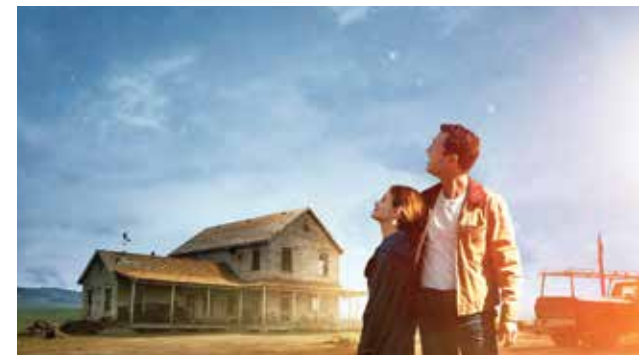
▲ Interstellar de Christopher Nolan