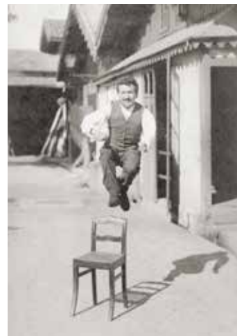
Auguste Lumière, 1881 ▲

Laissez-vous guider au travers de la grande histoire du pré-cinéma, jusqu'aux balbutiements du Cinématographe Lumière, et profitez d'une prestation adaptée aux plus petits.