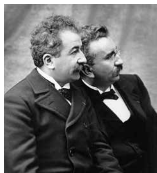
▲ Auguste et Louis Lumière

► Pour les collèges (4 e et 3 e ) et lycée et pour les groupes adultes