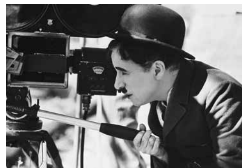
▲ Charlie Chaplin en tournage