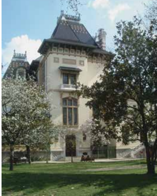
▲ La villa Lumière de Monplaisir