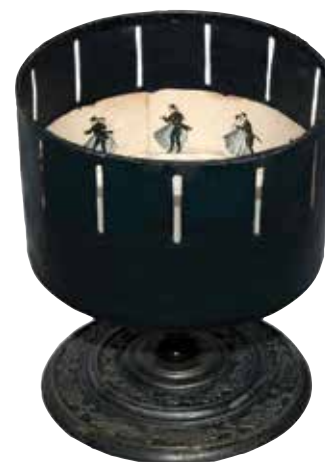
▲ Le Zootrope