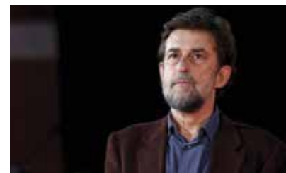
▲ Nanni Moretti

Le documentaire évoque Charles Chaplin, Buster Keaton, Oliver Hardy et Stanley Laurel, les Marx Brothers, puis Jerry Lewis qui ressuscite la comédie dans les années 1960.