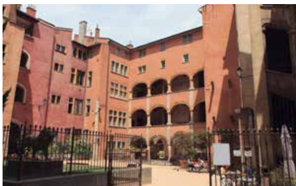
▲ Le Musée Miniature et Cinéma installé dans l'ancienne Maison des Avocats

4€ /enfant – 15ans et 5€ /enfant + 15 ans (étudiants jusqu'à 26 ans inclus); gratuit pour les accompagnateurs Pass Région Accepté (arts et savoirs / musées)