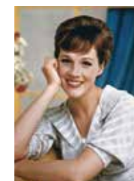
▲ Julie Andrews

Dix grands auteurs : Vittorio De Sica, Roberto Rossellini, Mario Monicelli, Dino Risi, Michelangelo Antonioni, Ettore Scola, Federico Fellini, Luchino Visconti, Pier Paolo Pasolini et Nanni Moretti.