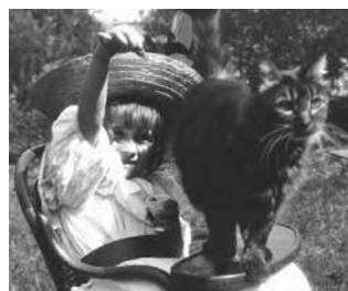
▲ Photogramme Lumière, La Fillette et le chat