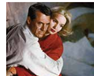
▲ La Mort aux trousses d'Alfred Hitchcock