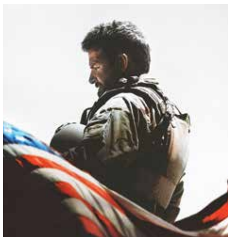
▲ American Sniper de Clint Eastwood