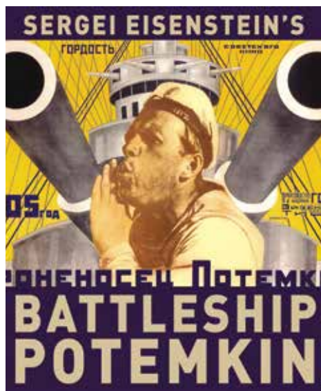
▲ Le Cuirassé Potemkine de Sergueï M. Eisenstein