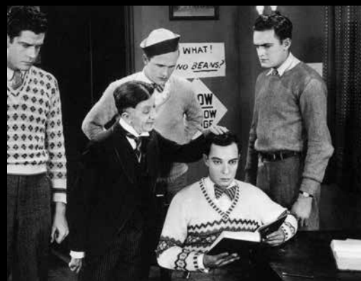
Buster Keaton dans College

Le combat du boxeur entre 1967 et 1973 pour retrouver ses droits civiques et sa licence de boxeur suite à son refus de faire la guerre du Vietnam. Réalisé pour la chaîne HBO, le film sera montré pour la première fois en salle en France après Cannes.