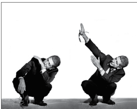
Leonard Cohen - Paris 1994