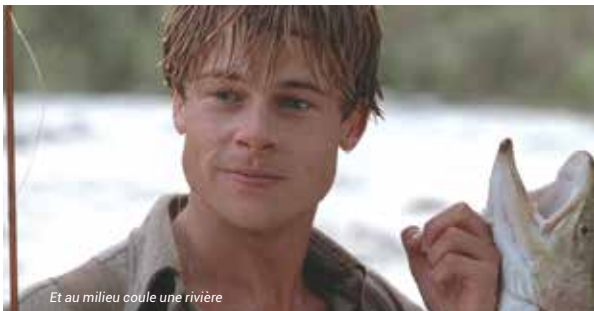
Et au milieu coule une rivière

Le délitement d'un couple, lui, ancien joueur de base-ball, elle, secrétaire... Par l'auteur de Yi Yi, un film inédit en France, avec Hou Hsiao-hsien dans le rôle principal. Un exemple du renouveau majeur qu'a représenté le cinéma taiwanais dans les années 1980-1990.