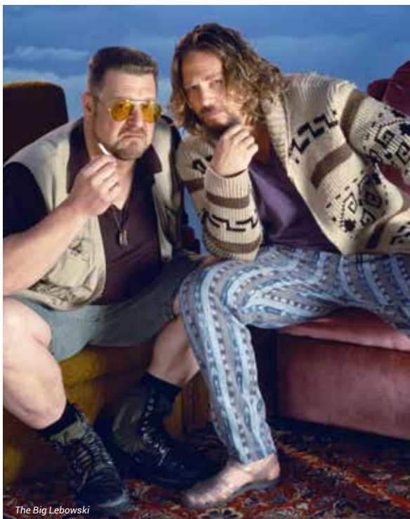
The Big Lebowski

Chaque semaine, de nombreux films ressortent en salles, dans des copies magnifiques. Trop nombreux parfois pour pouvoir tous les montrer, et tous les voir. À l'approche de l'été, et avant de nous quitter pour mieux nous retrouver à la rentrée, nous saisissons l'occasion de programmer treize de ces films que chacun peut rêver de voir ou de faire découvrir. Lynch, les frères Coen, Molinaro, Altman, Oshima, Malick, Redford, Olmi, Newman... Classique vénéré qui fit scandale, film sulfureux, comédies, polar, film culte inclassable, raretés italiennes, découverte asiatique... Belles séances et bel été à tous !