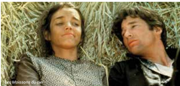
Les Moissons du ciel