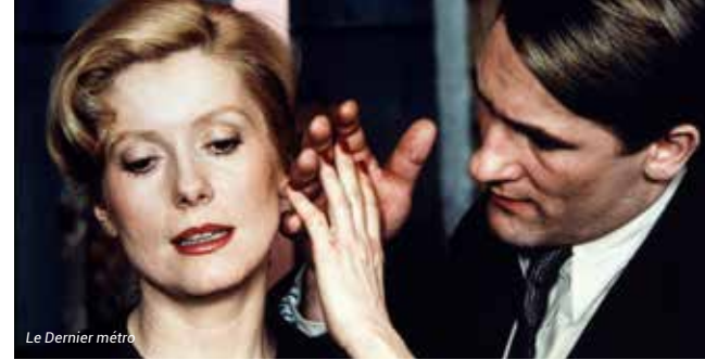
Le Dernier métro

La princesse Ann se rebelle ! Elle fugue et part visiter Rome... Week-end à Rome avec ce conte de fées moderne, classique de la comédie américaine, drôle et fantaisiste. Avec Audrey Hepburn et Gregory Peck.