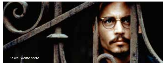
La Neuvième porte

De son enfance dans le ghetto de Cracovie, ses premiers films en Pologne, sa carrière internationale, le meurtre tragique de son épouse Sharon Tate, son arrestation en 1977, à sa vie et son travail aujourd'hui avec Emmanuelle Seigner, entretiens avec Polanski.