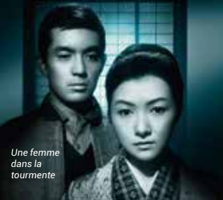
Une femme dans la tourmente

Reiko, veuve de guerre qui s'occupe du commerce de ses beaux-parents, voit son avenir menacé par l'ouverture d'un supermarché dans le quartier. C'est alors que Koji, son beau-frère, revient à la maison après avoir quitté son emploi à Tokyo... Longtemps inédit, un très beau et trop méconnu film de Mikio Naruse, enfin révisé en France.