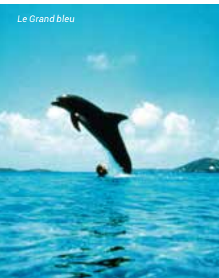
Le Grand bleu