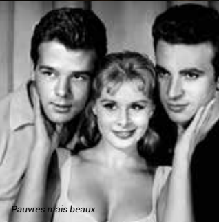
Pauvres mais beaux

A chaque programmation, découvrez une sélection de films rares ou méconnus en copies restaurées.