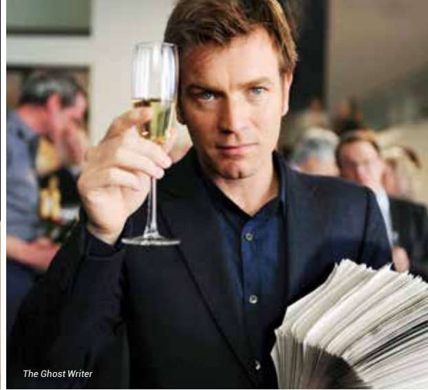
The Ghost Writer