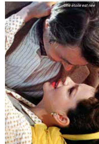
Une étoile est née