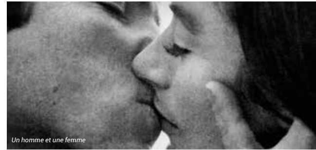
Un homme et une femme