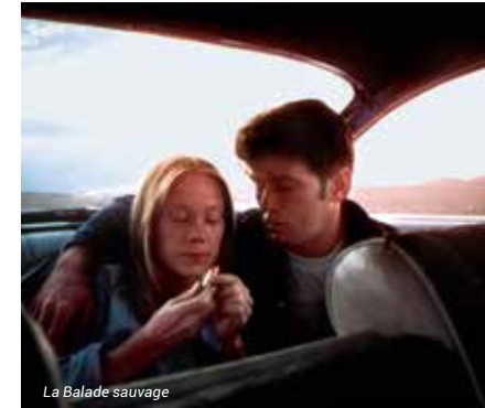
La Balade sauvage

« Une histoire d'amour entre deux personnes qui ne croient plus à l'amour. » Cet immense succès (Palme d'Or et deux Oscars !) de Lelouch fête son 50 e anniversaire. Avec Anouk Aimée et Jean-Louis Trintignant.