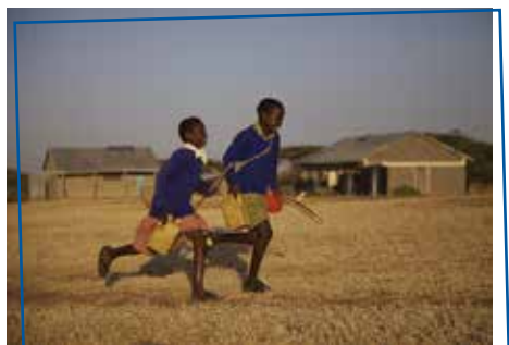
Sur le chemin de l'école de Pascal Plisson