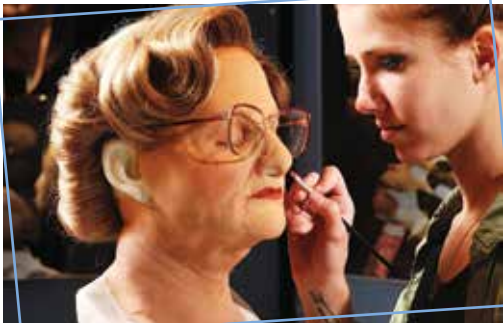
La restauration de l'authentique prothèse de Madame Doubtfire

Riche d'une collection de plus de 400 objets au- thentiques de tournages, un parcours pédagogique vous dévoile les secrets des plus grands studios européens et américains. Ces techniques d'illusions cinématographiques sont illustrées de maquettes, décors, prothèses, costumes, faux animaux, robots, monstres et créatures en tous genres. De la prothèse de « Mrs Doubtfire » au costume de « Gladiator », vous découvrirez que nos expositions abordent nostalquement un cinéma allant des années 60 à nos jours.