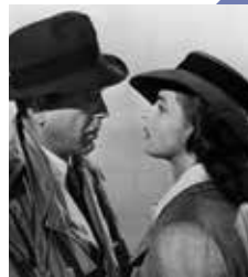
Casablanca de Michael Curtiz

Guerre de propagande et guerre totale, le cinéma a servi les deux camps pour mobiliser les troupes comme l'opinion publique, tout en décrivant la spécificité de cette seconde guerre mondiale : des combattants s'affrontant tant sur les fronts que dans les territoires occupés.