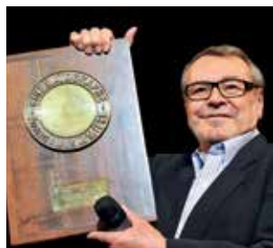
Miloš Forman Prix Lumière 2010

Chaque année, le festival Lumière travaille activement avec les établissements scolaires. Plus de 4000 écoliers, collégiens et lycéens participent chaque année au festival.