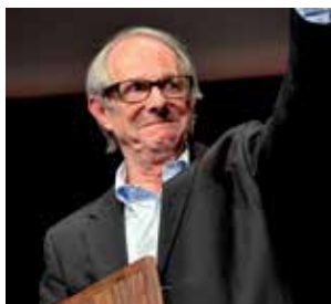
Ken Loach Prix Lumière 2012