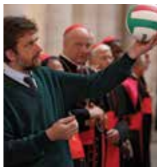
Nanni Moretti en tournage