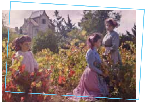
Famille Lumière en Autochrome

Les élèves découvriront ensuite les principales inventions des frères Lumière : le Cinématographe, le kinora, le photorama, la projection 75mm et l'Autochrome (la photographie couleurs). Ils visiteront aussi le premier étage avec la chambre d'Antoine Lumière et ses objets d'époques et le grand panneau biographique de l'histoire de la famille.