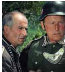
La Grande vadrouille de Gérard Oury