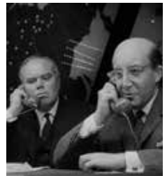
Docteur Folamour... de Stanley Kubrick