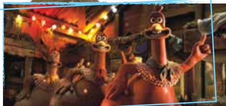
Chicken Run de Peter Lord et Nick Park