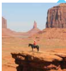
Monument Valley (Arizona), le décor des films de John Ford

Le western est né avec le cinéma américain qui illustre, à la fin du XIX e siècle, les récits populaires et folkloriques de la conquête de l'Ouest aux États-Unis. En 1939, John Ford réalise La Chevauchée fantastique et le western prend ses marques définitives.