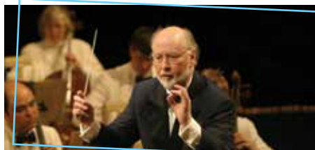
John Williams, compositeur de Star Wars