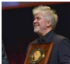
Pedro Almodóvar Prix Lumière 2014