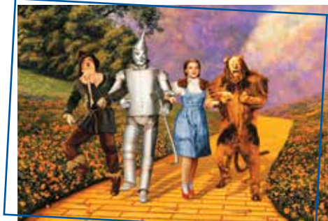
Le Magicien d'Oz de Victor Fleming