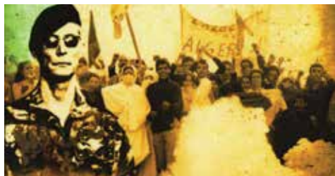
La Bataille d'Alger de Gillo Pontecorvo