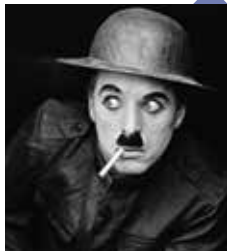
Charlie Soldat de Charlie Chaplin

Au lendemain de ce premier conflit planétaire, le cinéma a conservé sur pellicule les souvenirs de la Grande Guerre, montrant son caractère total mais décrivant surtout l'expérience combattante de soldats envoyés à la mort dans les tranchées.