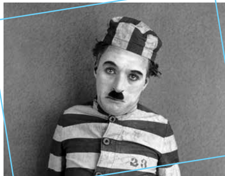
Charlot s'évade de Charlie Chaplin

Du mardi au vendredi de 9h30 à 18h30 Groupe de 30 élèves maximum Durée de l'activité: 1h (atelier burlesque 40mn et visite accompagnée 20mn)