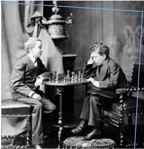
Famille Lumière en Autochrome

Ce documentaire est le plus juste sur l'histoire de cette famille ayant fait fortune à Lyon. Il retrace précisément l'ascension d'Antoine qui deviendra, grâce au génie de ses deux fils, un milliardaire en 20 ans à peine. Il s'appuie sur de très nombreux documents d'archives et des témoignages exceptionnels de spécialistes de la question Lumière.