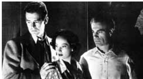
Berlin Express de Jacques Tourneur