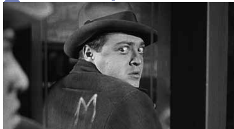
M le maudit de Fritz Lang