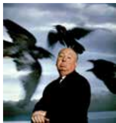
Les Oiseaux d'Alfred Hitchcock