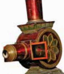
Lanterne Magique Lapierre (XIX e s)