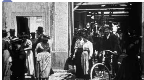
Sortie d'Usine de Louis Lumière

Cette séance pour les classes de 4 ème permet d'aborder avec des films simples, contemporains ou légèrement postérieurs à la 1 ère guerre mondiale, le programme de fin d'année tout en appréhendant déjà un peu les enjeux évoqués en 3 ème .